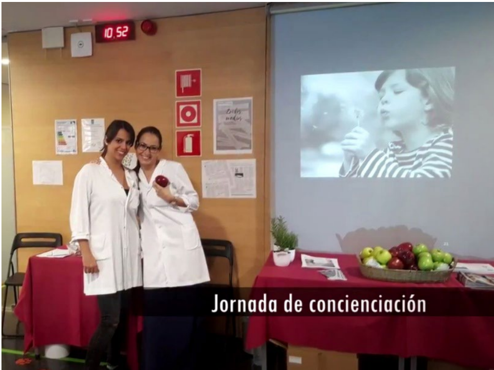
Jornada de concienciació