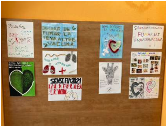
Germanes Hospitalàries del Sagrat Cor de Martorell

Hosp. Germans Trias @hgermantrias Estem a la XXII Setmana sense fum. A #hgermantrias ens sumem a les accions de sensibilització amb una exposició dels rètols anuals de l'esdeveniment, al passadís de la planta baixa. Deixar de fumar, la teva altra vacuna #ssfcat21 #sumasalut