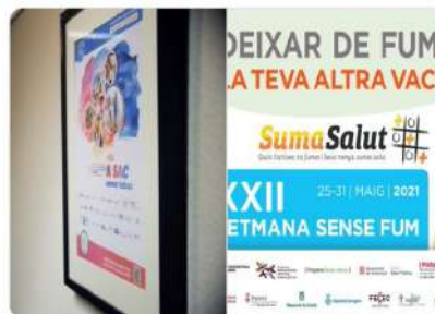
Hospital Universitari Germans Trias i Pujol

Hosp. Germans Trias @hgermantrias Estem a la XXII Setmana sense fum. A #hgermantrias ens sumem a les accions de sensibilització amb una exposició dels rètols anuals de l'esdeveniment, al passadís de la planta baixa. Deixar de fumar, la teva altra vacuna #ssfcat21 #sumasalut