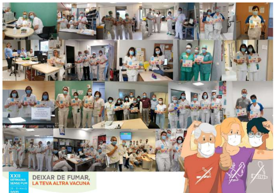
Fundació Hospital de l'Esperit Sant

XXII SETMANA SENSE FUM 25-31 MAIG 2021 DEIXAR DE FUMAR, LA TEVA ALTRA VACUNA