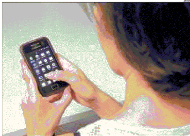
Els mòbils, una nova eina per deshabituar-se del tabac.